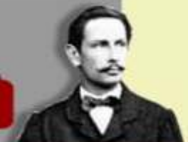
1886 Carl Benz