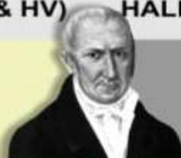
1801 Alessandro Volta