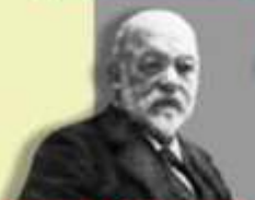
1885 Gottlieb Daimler