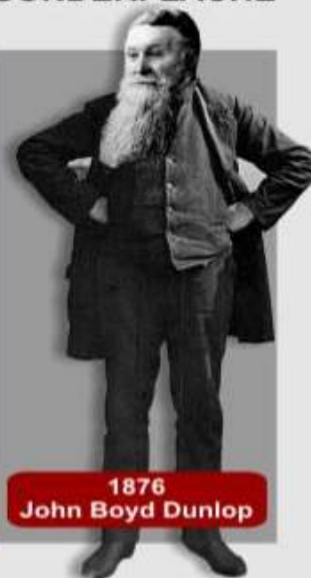
1876 John Boyd Dunlop