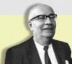
1954 Felix Wankel