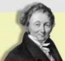
1817 Karl Drais