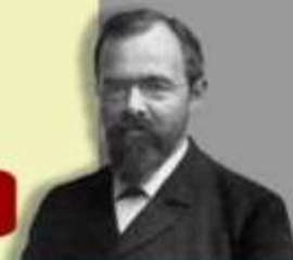
1871 Carl v. Linde