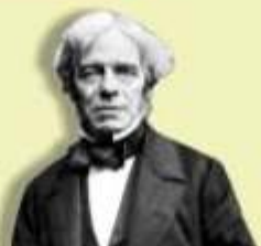
1825 Michael Faraday