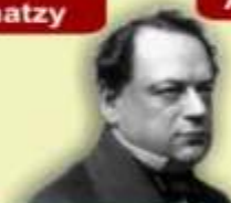
1834 Moritz v. Jacobi