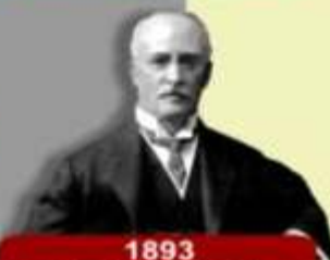
1893 Rudolf Diesel