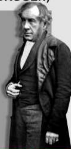
1839 William R. Grove