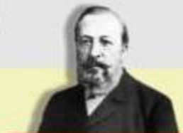
1876 Nicolaus A. Otto